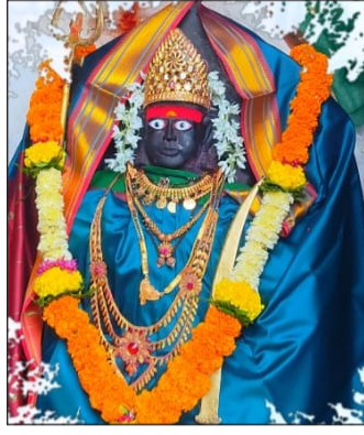
दरवर्षीप्रमाणे याही वर्षी भक्तिमय आणि आनंदाच्या वातावरणात साजरा करण्यात आला.

नियोजनानुसार दिनांक २८ फेब्रुवारी २०२४ रोजी देवी आईचा अभिषेक, इंजाईदेवी पालखी मिरवणूक सोहळा, हळदीकुंकू समारंभ, आईचा गोंधळ, इंजाई देवी आणि हनुमान नैवेद्य (बडाम) आणि रात्री भजनी मंडळ मानेगाव यांचा भजनचा कार्यक्रम आयोजित केला होता. तसेच दिनांक २९ फेब्रुवारी २०२४ ला सकाळी श्री. हनुमान अभिषेक, आईच्या सुहासिनी (आई इंजाईदेवी मंदिर मध्ये) आणि सायंकाळी आईच्या महाप्रसादाचा कार्यक्रम आयोजित करण्यात आला होता. देवीचा भंडारा उत्सव