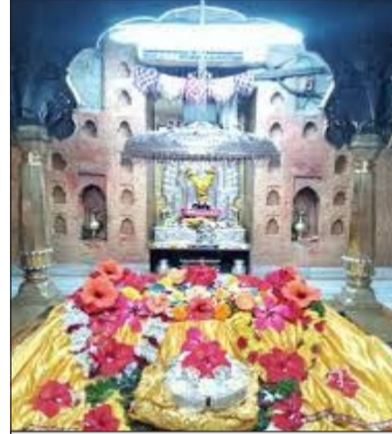
रामदास नवमी निमित्त आकर्षक सजावट करण्यात आली होती