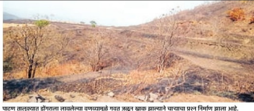
पाटण तालुक्यात डोंगररांगा लावलेल्या वणव्यामुळे नसत असून आक जाल्याने चाऱ्याचा प्रश्न निर्माण झाला आहे.

चाऱ्याचेही नुकसान : जनावरांच्या चाऱ्याचा प्रश्न बिकट