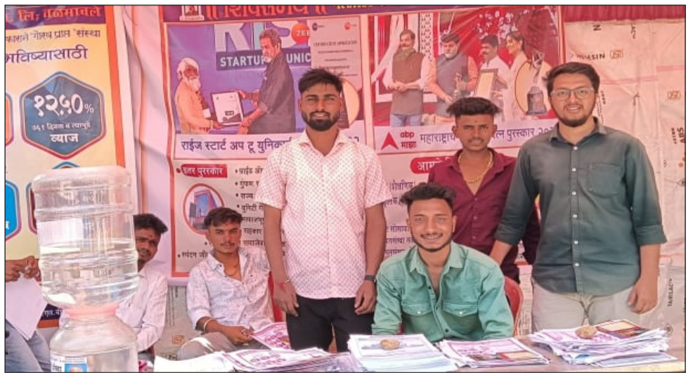
करंबळ कर्नाटक श्री लक्ष्मीदेवी यात्रेनिमित्त ग्राहकांना संस्थेच्या पत्रकाची माहिती देताना शिवसमर्थ परिवाराचे अधिकारी व कर्मचारी वर्ग